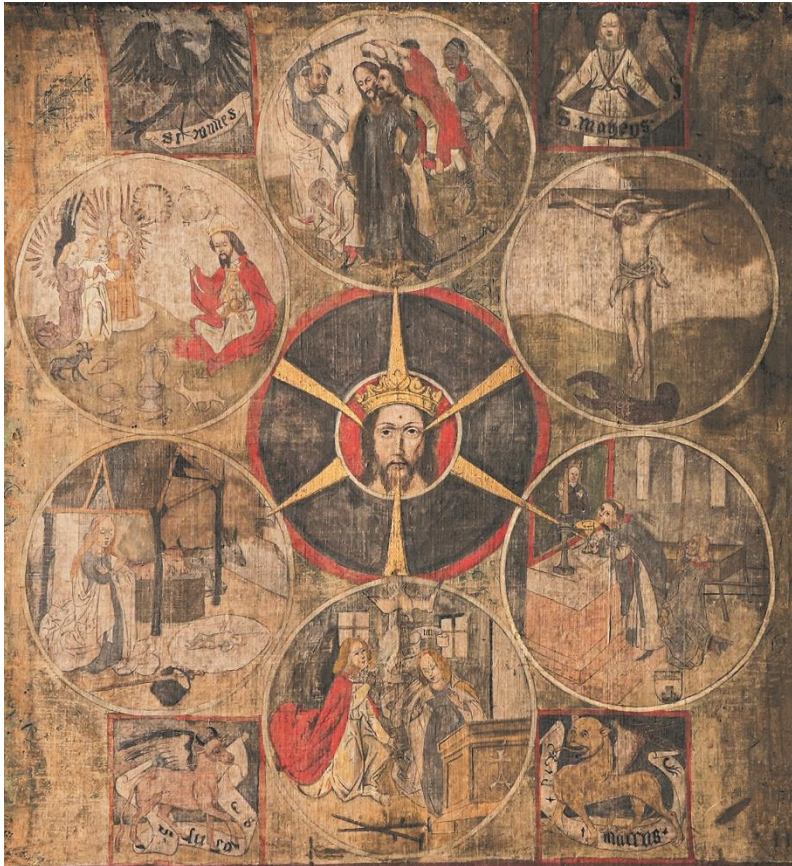
Weitere Infos: www.bruderklaus.com