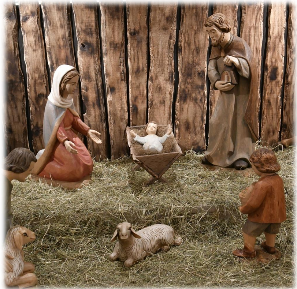
Foto: Krippe in St. Johannes Baptist, Herford

Wir wünschen allen Leserinnen und Lesern ein frohes und gesegnetes Weihnachtsfest und einen guten Start ins neue Jahr 2024!